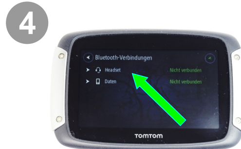
4 Headset hinzufügen