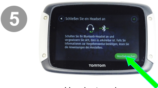
5 Headset suchen