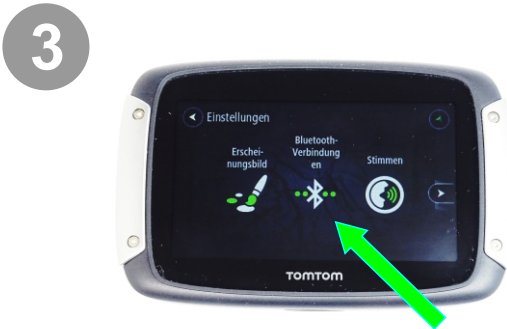
3 Einstellungen Bluetooth