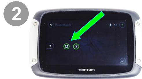
2 Einstellungen Aufrufen